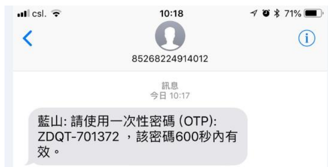
圖 5：手機短訊接收到的單次有效密碼