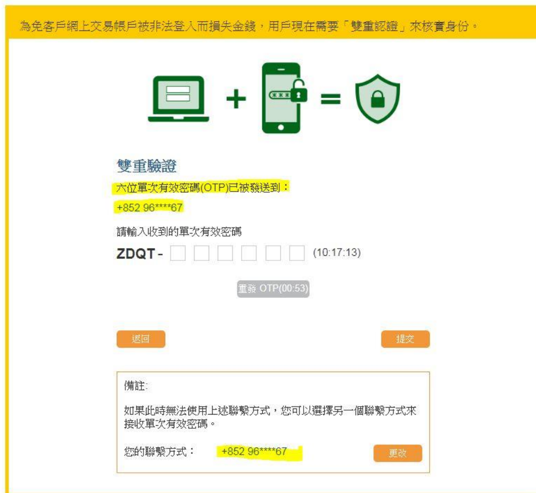
圖 4：更改後，將以手機接收單次有效密碼

#4 成功更改聯繫方式後，你將會看到以下的板面。單次有效密碼(OTP)將會發送到你登記的手機號碼，手機也會收到短訊。