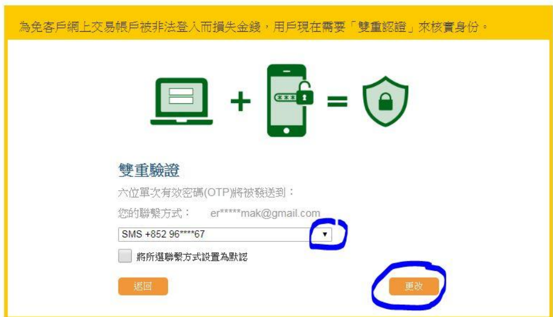
圖 3:更改雙重驗證聯繫方式

#3 若閣下因各種原因未能以上述其中一種方法收取單次密碼（如身處外地，未能用香港手機號碼收取），閣下可自行更改收取渠道（見圖 1 右下角的紅圈），請注意部份電郵可能會因為國家政策而無法在中國內地接收。按「更改」後系統會顯示以下板面，請依「藍圈」所示檢示你的聯繫方式，然後再按右下角的「更改」確定。