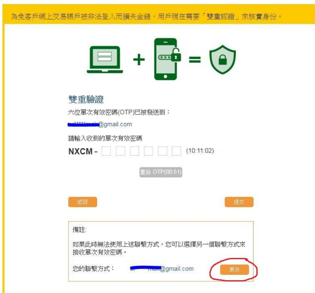
圖 1：雙重驗證登入版面